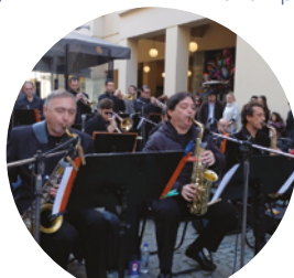
Athens Big Band