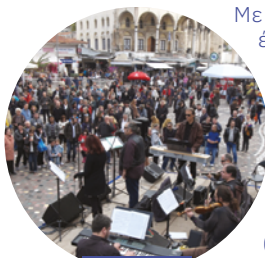
Εργαστήρι Ελληνικής Μουσικής

Διαδρομή: Μετρό Ακρόπολη, Σέλλεϊ, Βύρωνος, πλ. Αγίας Αικατερίνης, πλ. Φιλομούσου Εταιρείας, Κυδαθηναίων, Αδριανουπόλεως, Τριπόδων, Φλέσσα, Λυσίου, Μάρκου Αυρηλίου, Αδριανού, πλ. Μοναστηρακίου, πλ. Ψυρή