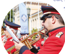
Φιλαρμονική Ορχήστρα δήμου Αθηναίων

Σε συνεργασία με τους καταστηματάρχες της περιοχής