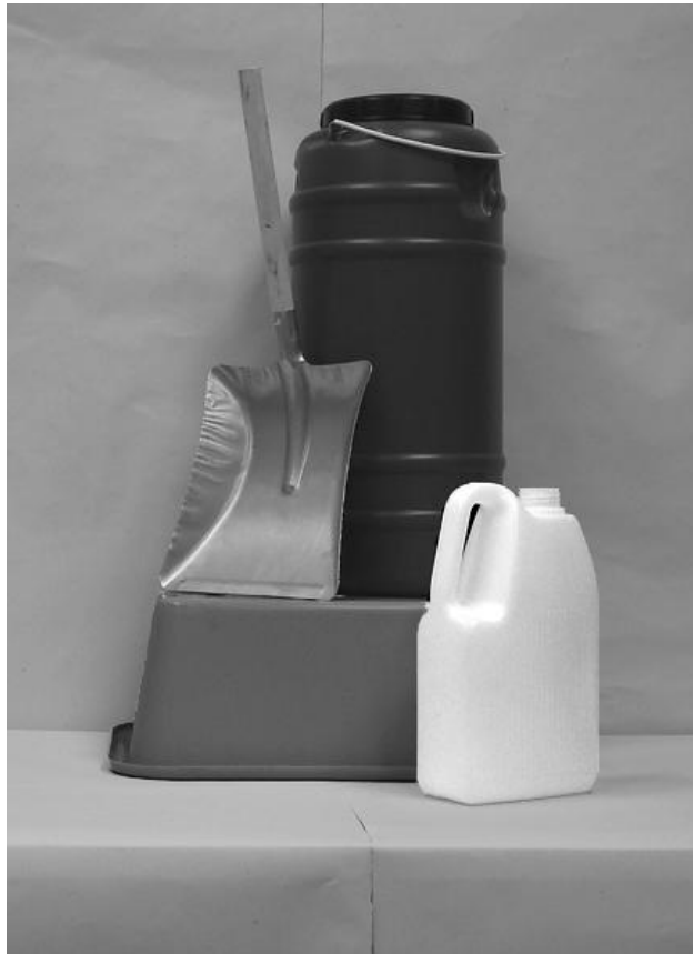
Πρώτη φωτογραφία: Μπροστινή όψη