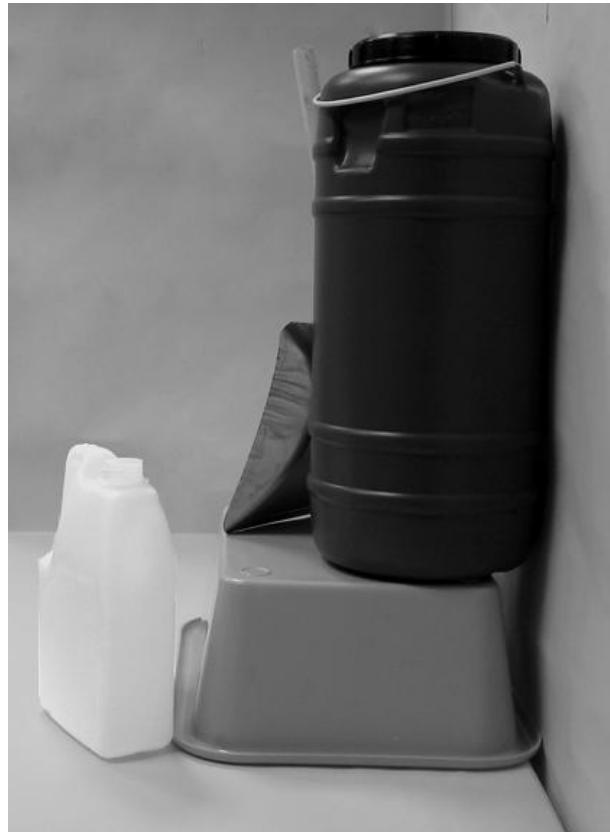
Τρίτη φωτογραφία: Πλάγια όψη