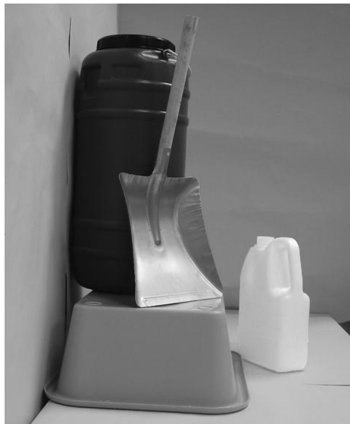
Τέταρτη φωτογραφία: Πλάγια όψη