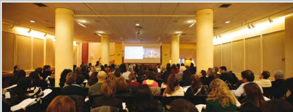
Οι αίθουσες Λόγου και Τέχνης όπου πραγματοποιούνται τα μαθήματα