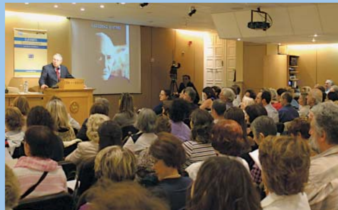
Ο καθηγητής Γ. Μπαμπινιώτης σε μάθημα για τον Οδυσσέα Ελύτη στο Ελεύθερο Πανεπιστήμιο