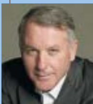
Δημήτρης Β. Νανόπουλος

Ομότιμος και επίτιμος καθηγητής Γλωσσολογίας και τ. Πρύτανης, Πανεπιστήμιο Αθηνών